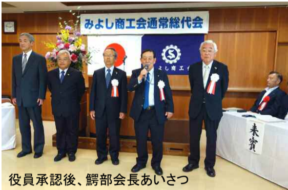
役員承認後、鰐部会長あいさつ

第58回みよし商工会通常総代会が5月22日、保田ヶ池センターで開催されました。新役員や新年度事業計画などが承認されました。