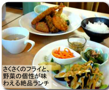
さくさくのフライと、野菜の個性が味わえる絶品ランチ

今日の「おまかせランチ」の中にも、サラダプレートには「ごちそうサラダナス」や「万願寺とうがらしの素揚げ」「赤オクラ」など、フライ盛り合わせには「甘長(ししとう系野菜)」「バターかぼちゃ」「ししびい(ししとうとピーマンの交配種)」「白ゴーヤ」「バナナピーマン」「ヒスイ(宝石の翡翠)ナス」など、ランチ全体で10数種類以上のお野菜を使っています。