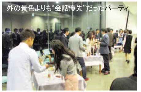
外の景色よりも“会話優先”だったパーティ

そして最終的に10組のマッチング成果が披露されると、会場にもどよめきが。今回、カップル成立者には、長島スパークランド・フリーパス券(ペア1組)、名古屋港水族館入場券(ペア2組)、映画券(ペア7組)がプレゼント