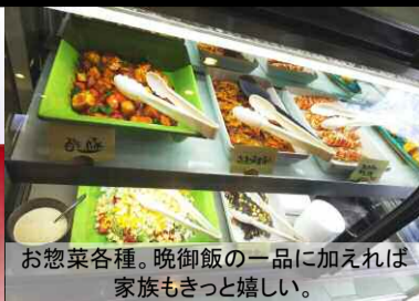
お惣菜各種。晩御飯の一品に加えれば家族もきっと嬉しい。

●お惣菜の特長を…【石田さん】ひじきコロッケや自家製だし巻玉子、エビとホタテのマヨサラダなど、常時7~8種類用意しています。(写真上)。