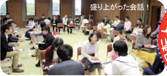
盛り上がった会話!