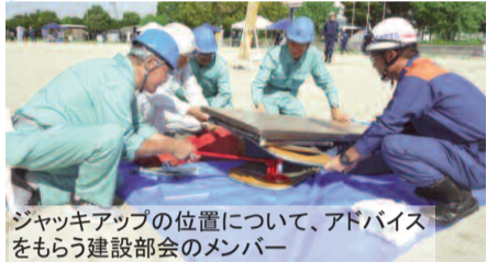
ジャッキアップの位置について、アドバイスをもらう建設部会のメンバー

また、建設部会では、尾三消防署の職員とともに、倒壊したガレキの下敷きになってしまったという想定のもと、要救助者(訓練人形)を、ジャッキアップしながら救出する訓練に参加。ジャッキをセットアップする位置や(出来るだけ安定した水平な)、ジャッキアップする人間と引っ張り出す人間とが「声を合わせる」ことが大事だと、消防職員からアドバイスを受けていました。