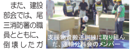
支援物資搬送訓練に取り組んだ、運輸分科会のメンバー

みよし商工会からも建設部会や運輸分科会(商業サービス部会)、事務局職員ら約20人が参加。「支援物資搬送訓練」に取り組んだ運輸分科会のメンバーは、非常時の食料やトイレトーパー、衣類など、物資名を張り付けた20箱ほどを会場に運び入れました。