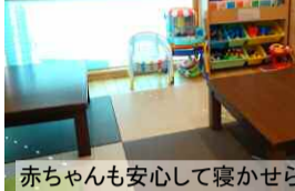
絵本やおもちゃもー