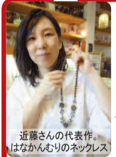
近藤さんの代表作。はなかんむりのネックレス

● 筋生町鳥居前47 ● 営業 木・金・土 午前10時~午後3時 ● TEL(0561)57-6204 ● メール ysk226@hm6.aitai.ne.jp