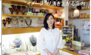
“イメージ”が湧き上がる店内