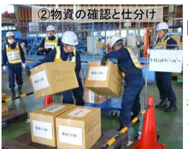
②物資の確認と仕分け

熊本県益城町の担当者は『訓練でやれないことは出来ない』と指摘していました。今こそ、行政・民間・住民が力を合わせての継続的な訓練、取り組みが必要ですね。