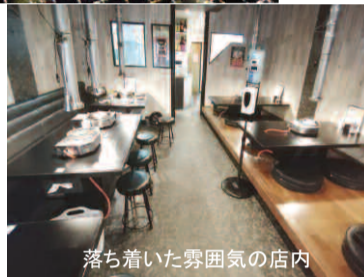
落ち着いた雰囲気店内