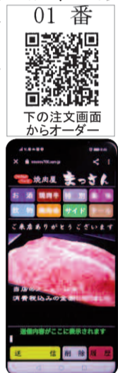
01番 QRコード 下の注文画面からオーダー

また、ぼくは走る(中長距離)のが大好きで、愛知県の市町村対抗駅伝大会、みよしの代表として走ったこともあります。当時の仲間や友人が、お店に足を運んでくれたことも、心の支えになりました。