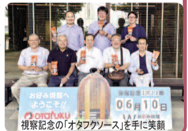
視察記念の「オタフクソース」を手に笑顔

造船所では世界最大の石油タンカーが停泊しており、これから製造されるであろう船の大きな部品が巨大なクレーンで釣り上げられ、それらを溶接して70日ほどで船体を組み上げていく、現代の造船技術を間近で見学。普段、会員たちが取り組む製造現場とは違ったスケールや業務内容に、大いに刺激を受けた研修となりました。