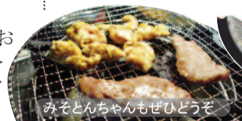
みそとんちゃんもぜひどうぞ