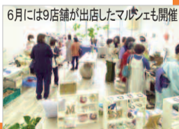
6月には9店舗が出店したマルシェも開催

“新しい働き方”や“人と人の色々な形のつながり方”などを模索する二人。6月には『個人事業主集まれ!』と税理士さんとの共同企画も実行。「みよしの経済活動と市民のつながりを発展させるような機会になれば嬉しいですね」と思いを膨らませています。