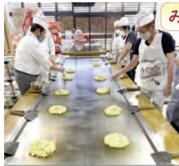
研修参加者もお好み焼き職人に変身?

●ひまわりネットワーク株式会社…メディアによる地域のSDGs啓発●東海学園大学…ともいきSDGsシンポジウム2022チャレンジアワード東学を開催●木戸造園土木株式会社…間伐材を利用した製品の開発●MYC…廃棄予定の柿を利用したカレーの提供、地産地消、フードロス削減●碧南信用金庫…SDGs寄贈型私募債募集、環境配慮型店舗・環境対応車の導入