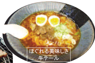
ほぐれる美味しさ牛テール

みよし店ではこれまでどおり、夜の営業で召し上がっていただけますので、ぜひ味わってみてください。