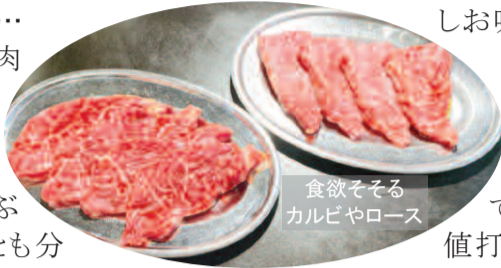
食欲そそるカルビやロース

しお味もご用意できます。Tボーンステーキは焼肉店では珍しいと思いますが、骨にサーロインとヒレの高級部位が付いていて、100gあたり880円とお値打ち。大体500g前後ありますので、ご家族やグループで分け合っていたらと思います。