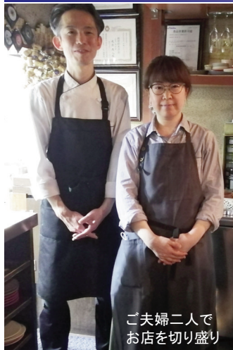
ご夫婦二人で お店を切り盛り