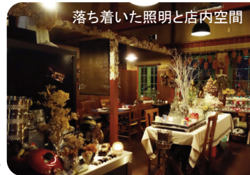
落ち着いた照明と店内空間