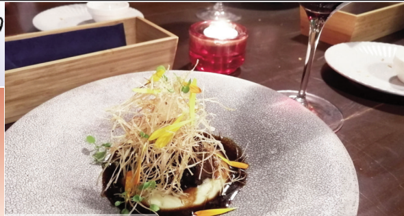
とろけるかのような 味わいのフィレステーキ