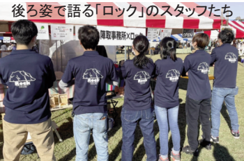
後ろ姿で語る「ロック」のスタッフたち

『背中語る』『サービス利用者と同じ方向を向く』。“一枚岩の結束”が満足度の高いサービスを提供してくれることなのでしょうね。