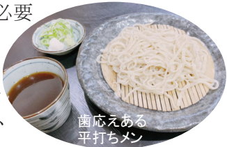
歯応えある 平打ちメン