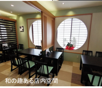
和の趣ある店内空間