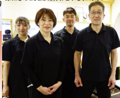
原田さんご夫婦(前列)とゆるりスタッフ

で、少し油っぽくなったお口を最後にさっぱりさせるのにもソバは締めを持ってこいす。