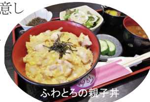
ふわとろの親子丼