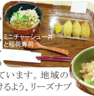
ミニチャーシュー丼と稲荷寿司

入り口入ってすぐのところに、食券(写真上)があるので、好きなメニューを選んでいただき、お子様や食事が少ない方が多い方は、通常の量の半分の“ミニ”も用意しています。地域の方々に気軽に入ってもらえるよう、リーズナブル