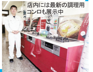
店内には最新の調理用コンロも展示中