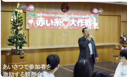
あいさつで参加者を 激励する髷部会長

「カジュアル婚活 inMIYOSHI・赤い糸大作戦」が昨年12月3日、保田ヶ池センターで開催されました。準備期間の短さや予算の少なさ