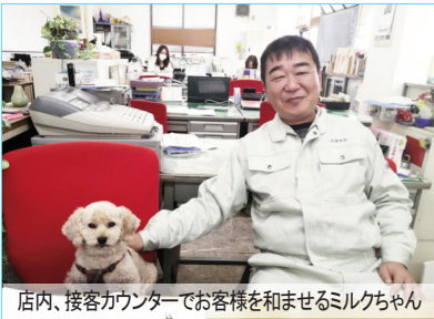
店内、接客カウンターでお客様を和ませるミルクちゃん

東に面白い店があると噂あれば走り西に暖かい話題があると聞けば一緒に喜び南にユニークな人いるとみれば感化され北にビックリあれば「ほ〜」とうなずきあらゆるところへ出向きます。