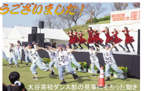
大谷高校ダンス部の見事にそろった動きグッズが釣れる「釣りゲーム」を楽しんだり、子どもさんたちのイキイキとした表情が印象的でした。

昨年11月5日、絶好の秋晴れのもとさんさんの郷で開催された「産業フェスタみよし2023」。節目の30回記念ということもあり、賑やかなステージイベント、多彩な飲食・物販ブース、みよしの友好都市「北海道士別市」「長野県木曾町」の特産品販売などで大勢の来場者でにぎわいました。