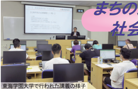
東海学園大学で行われた講義の様子

「夢を叶える第一歩!!」。 今年で9回目を迎えた「みよし創業塾 2024」が8月下旬から10月にかけて、延べ6日間(講座数12コマ)の日程で開催され、9名の方が受講しました。