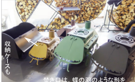
燃き口は、蝶の羽のような形を採り、開口部も

関車のようなデザイン。 業務用薪ストーブの火力(能力)を100とすると、それぞれその60%、40%の能力を發揮できるというコンパクトで移動も可能なストーブは、円形の薪ラックと合わせてインテリアとしての存在感も。また令和6年度、みよし市の補助金対象となっている「宅配ボックス設置補助」。重厚感ある(実際に重くてしっかり固定出来る)デザインに風雨を防ぎ、安全に開け閉めできるダンパー機能も備えています。