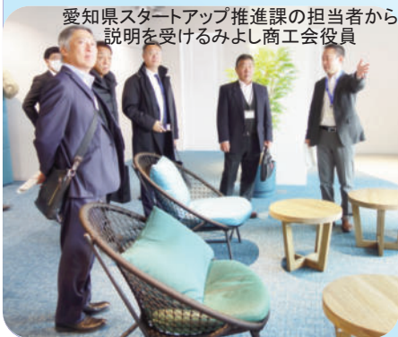
愛知県スタートアップ推進課の担当者から説明を受けるみよし商工会役員

愛知県が仕掛けるスタートアップ・エコシステムの形成などを図る拠点施設「STATION Ai」が2024年10月に鶴舞公園すぐ南側にオープンしました。スタートアップとは革新的なビジネスモデルで社会にイノベーションを生み出し、短期間に