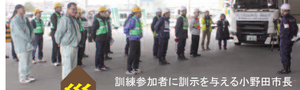
訓練参加者に訓示を与える小野田市長