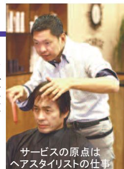
サービスの原点はヘアスタイリストの仕事