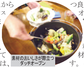
素材のおいしさが際立つダッチオープン

魚にトマトソースを合わせたり、和食以外の料理方法で、日本の素材を味わっていただきたいと思えます。ダッチオープンの残ったスープで