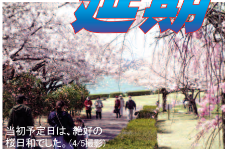
当初予定日は、絶好の桜日和でした。(4/5撮影)

イベントを楽しみにしていた市民の皆様、事業をバックアップしてくださったスポンサー様、商工会各会員、出店申込みいただきおりました事業者様に、紙面をお借りしお詫び申し上げます。なお、本事業は年度