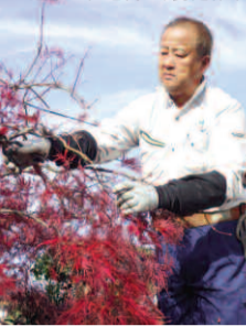
日進市の住宅街で、剪定作業

「この時期は(10~12月)年末までに、150軒以上の剪定作業の依頼があります。30~40年付き合ってくださいのお客様も多く、できるだけお値打ちに、きれいに仕上げたい。特に個人宅での仕事は、長年の人間関係や信頼関係で築いてきた“お付き合い”。仕事をいただいたり頼られたりということが有難いですね。」